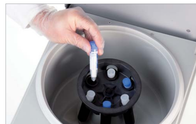
Centrifugação de Salivette para a colheita de saliva.