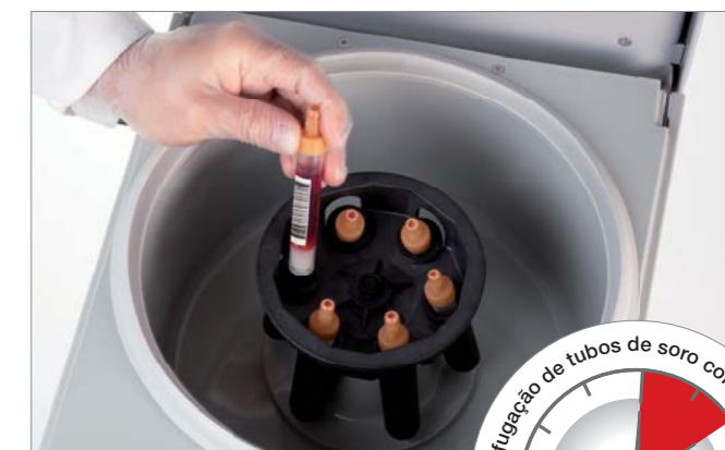
Centrifugação de S-Monovette para a colheita de soro/plasma.