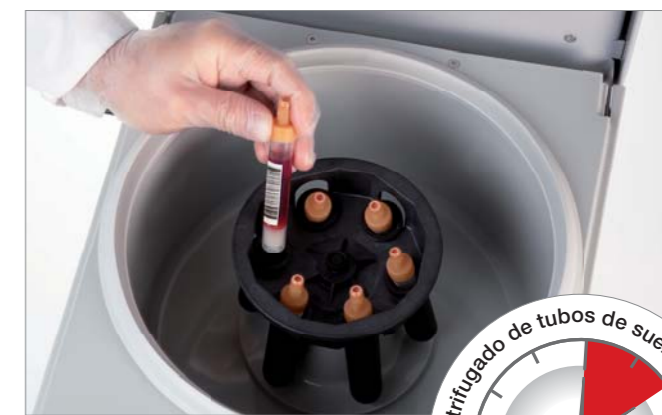
Centrifugado de S-Monovette® para la obtención de suero / plasma.