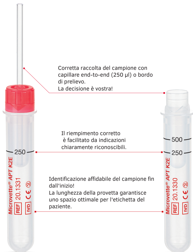
Microvette® APT 250