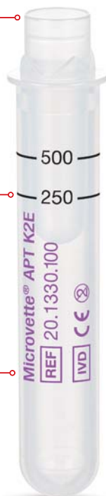
Microvette® APT 500

Análisis ágil: directo e higiénico desde el recipiente primario.