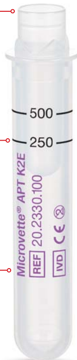
Microvette® APT 500

Análisis ágil: directo e higiénico desde el recipiente primario. El tapón de membrana de último diseño garantiza el transporte y el envío seguro de la muestra.