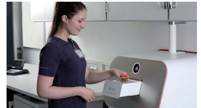
Mehrfacheingang für bis zu 25 Proben gleichzeitig