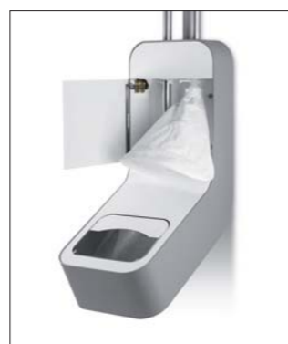
Filterbeutel zur Reinigung