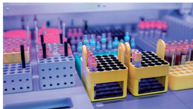
Automatische Ausgabe im Rack