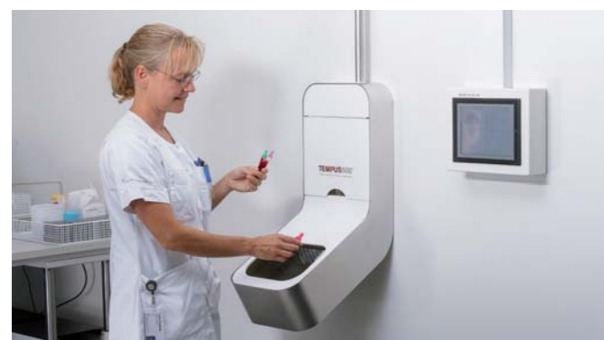
Die Proben kommen in der Empfangsvorrichtung an und können dort entgegengenommen werden.