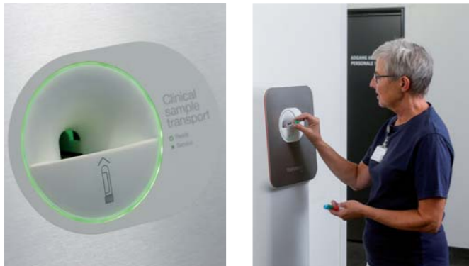
Die Probenröhrchen werden in der Eingabeöffnung der Vita-Station platziert.

Dank des schlanken und minimalistischen Designs braucht die Sendestation nur sehr wenig Platz und passt in fast alle Räumlichkeiten.