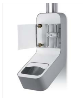
Empfangsvorrichtung mit Bremsmodul