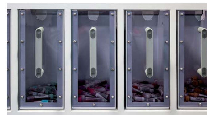
Verteilen in Zielboxen

Tempus600®, kombiniert mit dem Bulk to Bulk Sorter HCTS2000 MK2, vereinfacht die Arbeit im Probeneingang deutlich. Das Gerät registriert und sortiert geschlossene Probenröhren als Schüttgut anhand des Barcodes (Materialcode) oder auftragsbezogen nach Vorgabe des LIS in verschiedene Zielfächer. Bei Verwendung einer Kamera (optional) ermöglichen Plausibilitätskontrollen das Auffinden und Aussortieren von Fehlerproben. HCTS2000 MK 2 hilft dabei, Arbeitsabläufe beim Eingang der Proben im Klinisch-Chemischen Labor oder in der Hämatologie zu optimieren, und kann so die Durchlaufzeiten für Proben verkürzen.