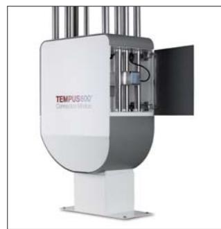
Anschlussmodul mit Bremsvorrichtung