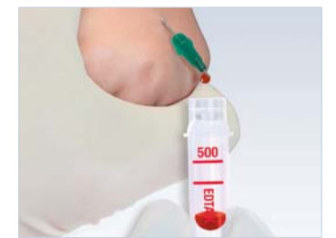
Microvette® cu acele micro