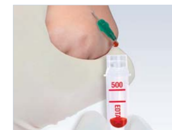
Microvette® come contenitore di gocciolamento