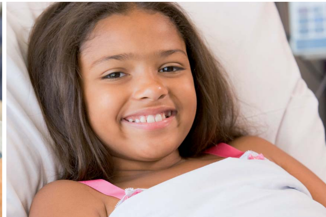
Bambini in età scolare