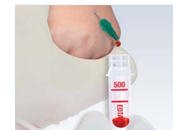
Microvette® взятие крови самотёком открытым способом