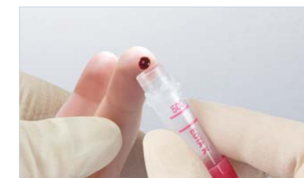
Microvette® 300/500 – pobieranie krwi krawędzią probówki