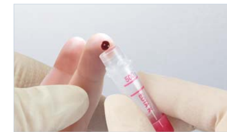
Microvette® 300/500 – prélèvement sanguin avec bord de recueil