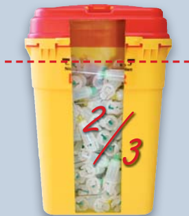
Ligne de remplissage respectée