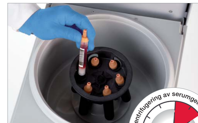
Sentrifugering av S-Monovetter for serum-/plasmautvinning.