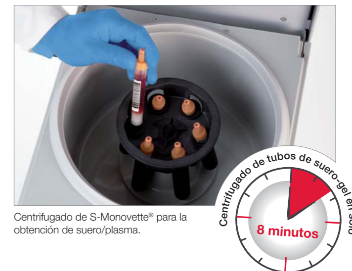
Centrifugado de S-Monovette® para la obtención de suero/plasma.