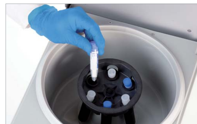
Centrifugado de Salivette® para la obtención de saliva.