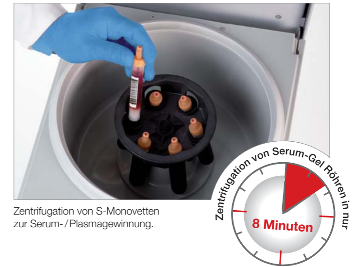
Zentrifugation von S-Monovetten zur Serum- / Plasmagewinnung.