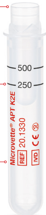
Microvette® APT 500

Analisi rapida – direttamente e in condizioni igieniche dalla provetta primaria. La chiusura a membrana di nuova concezione garantisce al contempo trasporto e invio sicuri del campione.