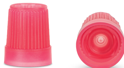
Microvette® APT 250

Новая мембранная крышка обеспечивает безопасность при транспортировке и пересылке пробы.