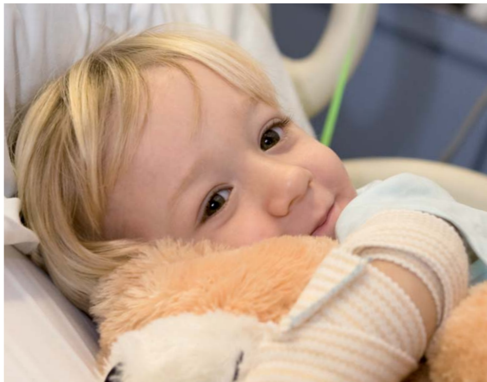
Spedbarn og småbarn