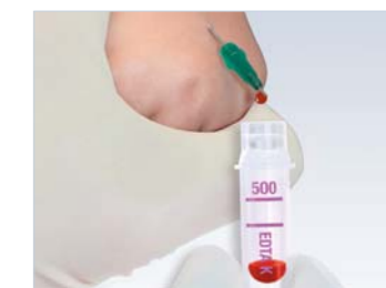
Microvette® med mikronål