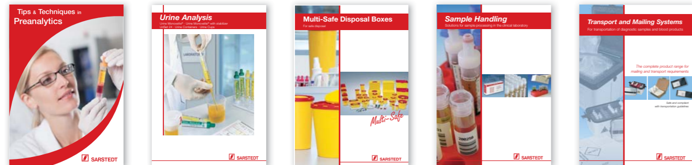
Prospecto 453 Prospecto 219 Prospecto 412 Prospecto 419 Prospecto 458