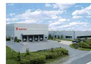
Бранд-Эрбисдорф, земля Саксония (Германия)