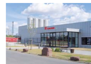
Райнбах, земля Северный Рейн - Вестфалия (Германия)