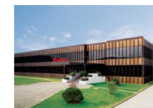
Хемер, земля Северный Рейн - Вестфалия (Германия)