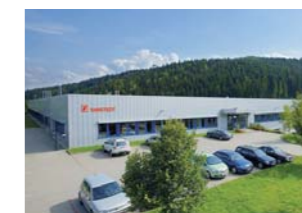
Клингенталь, земля Саксония (Германия)