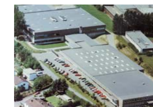
Βιλ, Βόρεια Ρηνανία-Βεσφαλία, Γερμανία