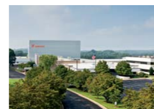
Νιούτον, Βόρεια Καρολίνα, Η.Π.Α.