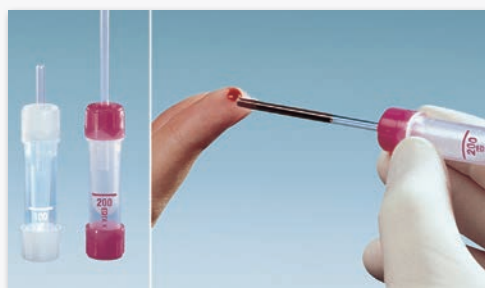
Microvette® 100/200 Odběr krve s kapilárou na principu „End-to-end“