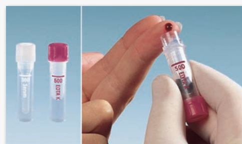
Microvette® 300/500 Odběr krve pomocí lemu nádobky

Další informace jsou k dispozici na požádání.